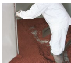
Lehren (Faschen) schütten, verdichten und auf Niveau abziehen.