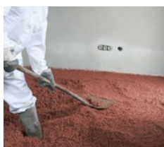
Die Anschlusskanten an der Mauer nacharbeiten und aufgetragene Fläche verdichten.