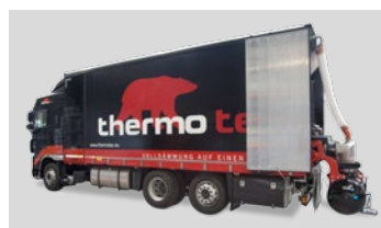
Lieferung, anmischen und pumpen erfolgt durch das thermotec® Mixmobil